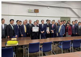
農村基盤整備議連で財務省要請