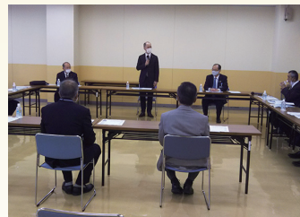
石川県の皆さんと意見交換