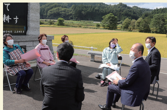
青森県下で女性の皆さんと対談