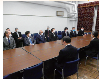
水産関係予算の確保について財務省要請