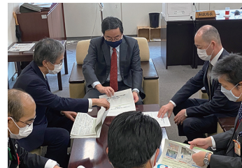
瀬戸内6県のため池対策要望に同行