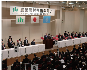
農業農村整備の集いで挨拶