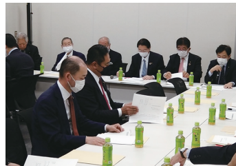
漁港漁場整備議連総会に出席