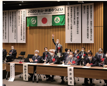
治山・林道の集いに参加