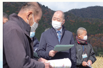
滋賀県下で農業振興の構想を聴く