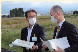
富山県下のR3新規着工予定地区を調査