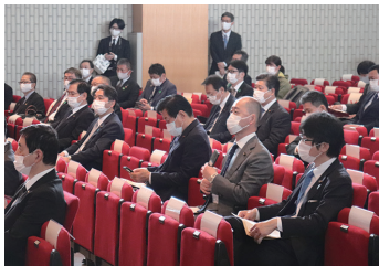
森林整備・治山事業促進議連緊急決起大会に参加