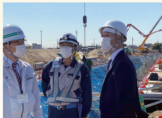
愛知県下の事業実施現場を視察