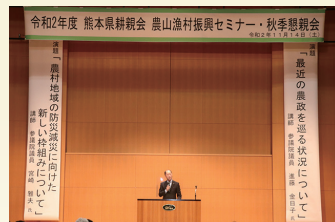
熊本の農山漁村振興セミナーで講演