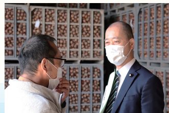
北海道のタマネギ集出荷施設を視察し意見交換