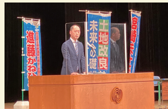
長崎県下で国政報告